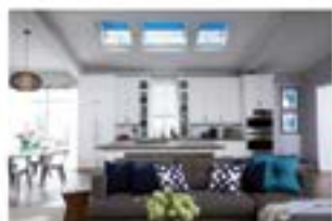
Toute la lumière dans l'espace de vie