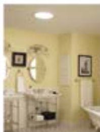
Tunnel de lumière

Quand la lumière naturelle est source de vie... le puits de lumière est aussi une valeur ajoutée aux immeubles.