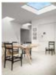
Un coin repas sans fenêtre dans la clarté