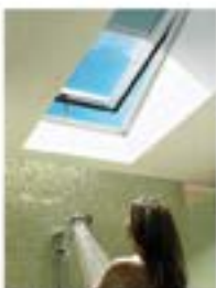
Le soleil dans votre douche