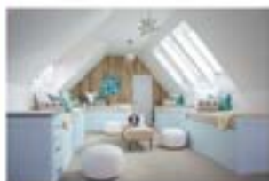
Un aménagement sous-toit bien lumineux